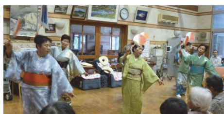
野菊の会の みなさん