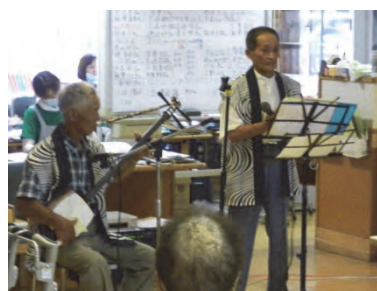
三峰会の みなさん

偶然の出会いから今回初めてデイサービスへ足を運んでくださった、大正琴フラワーショップのみなさんです。演奏はもちろんのことお話も楽しくてまたお会いできるのを楽しみにしています。