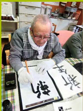
何事にも真剣に取り組んでくれる利用者さんたちです。