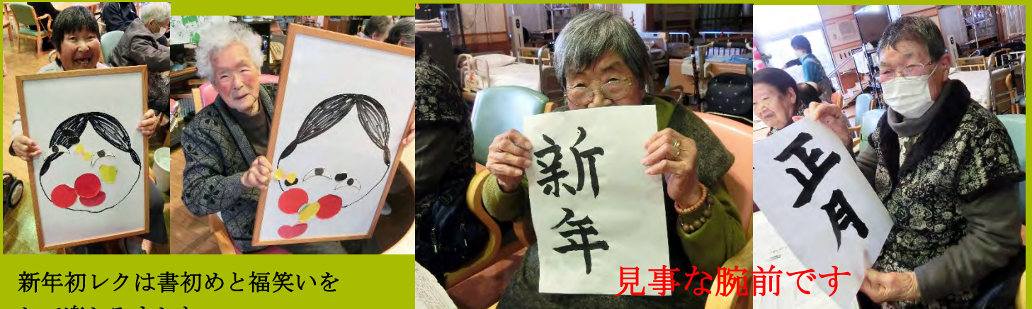
新年初レクは書初めと福笑いをして楽しみました